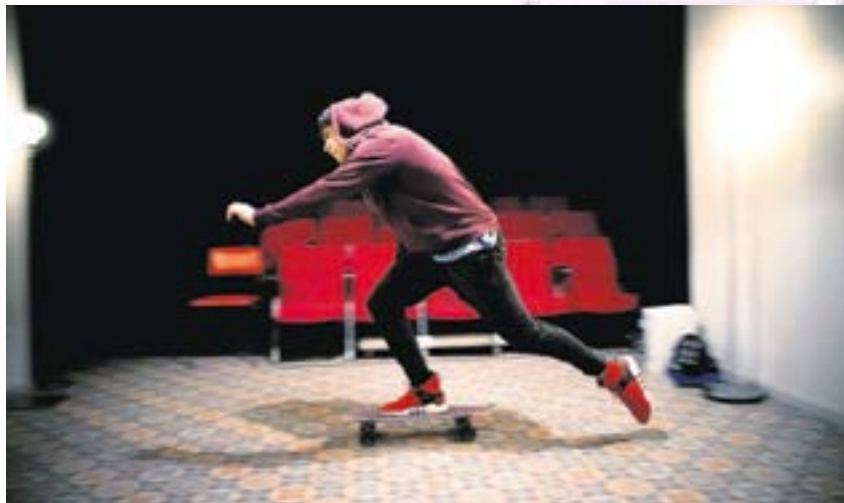
Una escena de A. K. A. , de Daniel J. Meyer. ROSER BLANCH